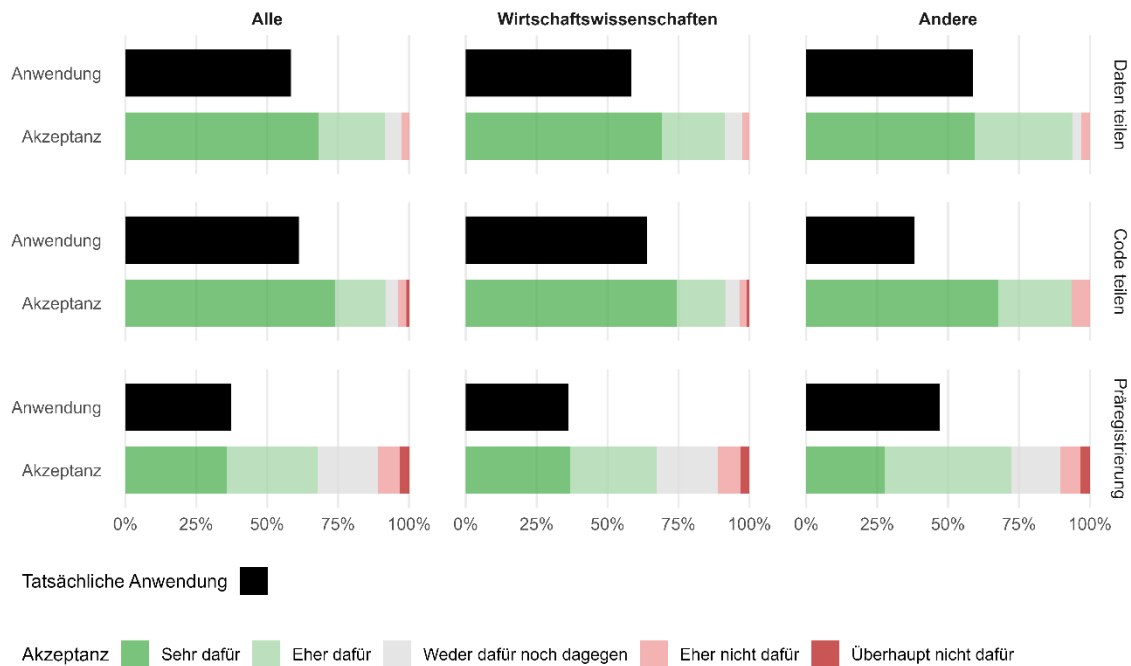
Abbildung 1: Anwendung und Akzeptanz von Open-Science-Praktiken

Abbildung 2 vergleicht die tatsächliche Nutzung von Open-Science-Praktiken mit den Wahrnehmungen der Forschenden darüber, wie verbreitet diese Praktiken in ihrem jeweiligen Fachgebiet sind. In jedem Panel zeigt der obere Balken den Anteil der Wissenschaftler:innen in einer bestimmten Disziplin, die berichten, eine bestimmte Open-Science-Praxis mindestens einmal angewendet zu haben; der darunterliegende Balken gibt die durchschnittlichen Einschätzungen der Befragten darüber wieder, welcher Anteil der Forschenden in ihrem Fachgebiet dies getan hat. Das linke Panel fasst die Ergebnisse für alle Befragten zusammen, das mittlere Panel konzentriert sich auf die Antworten von Ökonom:innen und das rechte Panel zeigt die Antworten von Nicht-Ökonom:innen. Die Daten zeigen, dass Open Science Techniken sehr viel verbreiteter sind als es von den Forschenden wahrgenommen wird.